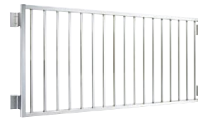
たて格子 (写真は単体面格子の場合)